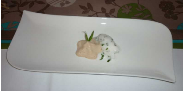
Zitronen-Estragon-Parfit mit Büffellikör-Espuma