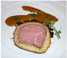
Büffelroastbeef im Brotmantel auf Belugalinsen