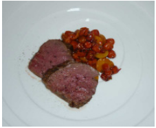
Büffelroastbeef in Cola gegart an Physali-Ebereschenragout