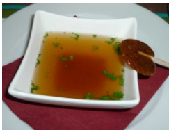
Büffel-Consommé mit Sojasaucen-Lolly