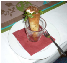
lauwarmer Büffelfeta mit Mangofüllung auf Kräuter-Kresse-Salat in Lavendelhippe