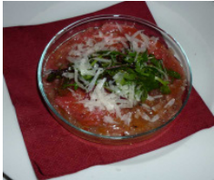
Carpaccio aus der Büffel-Seemerrolle