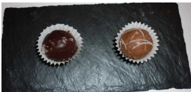
Trüffel mit Büffellikör und Büffelcremefüllung