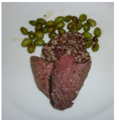
Büffel-Entrecote an Edame-Bohnen und Quinoarisotto