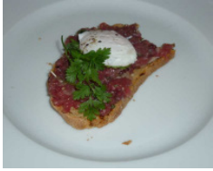
Bruschetta mit Büffeltartar, porchiertes Wachtelei