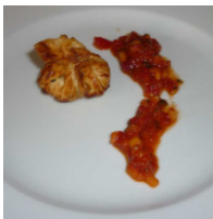
Büffelragout in Wan Tan Teig mit Tomaten-Papaya-Salsa